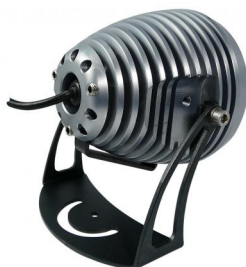
Orientable 3 axes