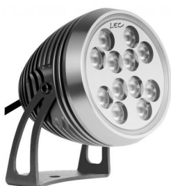
Orientable 2 axes