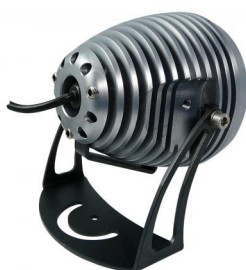
Orientable 3 axes