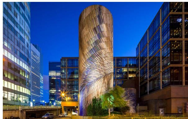
Vive le Vent - Michel Deverne (1985)

2 projecteurs 4040m-Luminy 4 en 12 LED 3W blanc neutre, optique L4 sont encastrés au sol.