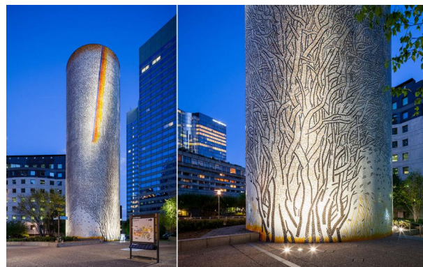
Les Trois Arbres - Guy-Rachel Grataloup (1988)

3 projecteurs en applique 4040-Luminy 4 en 12 LED 3W blanc neutre, optique 6° illuminent l'oeuvre.