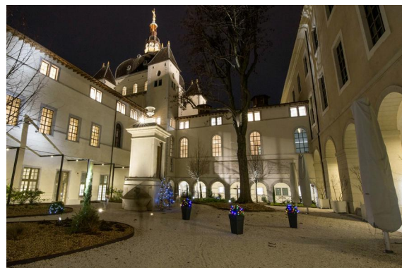
Mise en valeur de la fontaine centrale d'une des cours intérieures à l'aide de 4 projecteurs 2855-Meteor