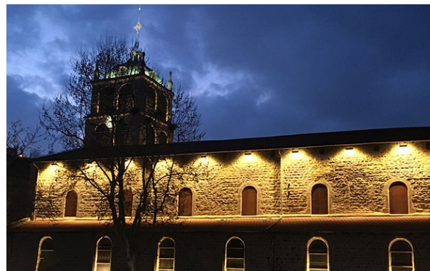
Plusieurs Lima ref 5683 3000K sont installés régulièrement tout au long de la façade côté jardin pour éclairer l'édifice et sublimer les murs en pierres.

Domaines d'applications LEC autour du patrimoine