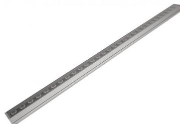
Longueur = 485 mm