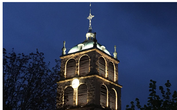
2 Lignon ref 5655 4000K de chaque côté de la toiture (8 au total) subliment le dôme du clocher et mettent en valeur sa couleur verte