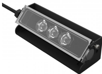
Version mini avec 3 LEDs