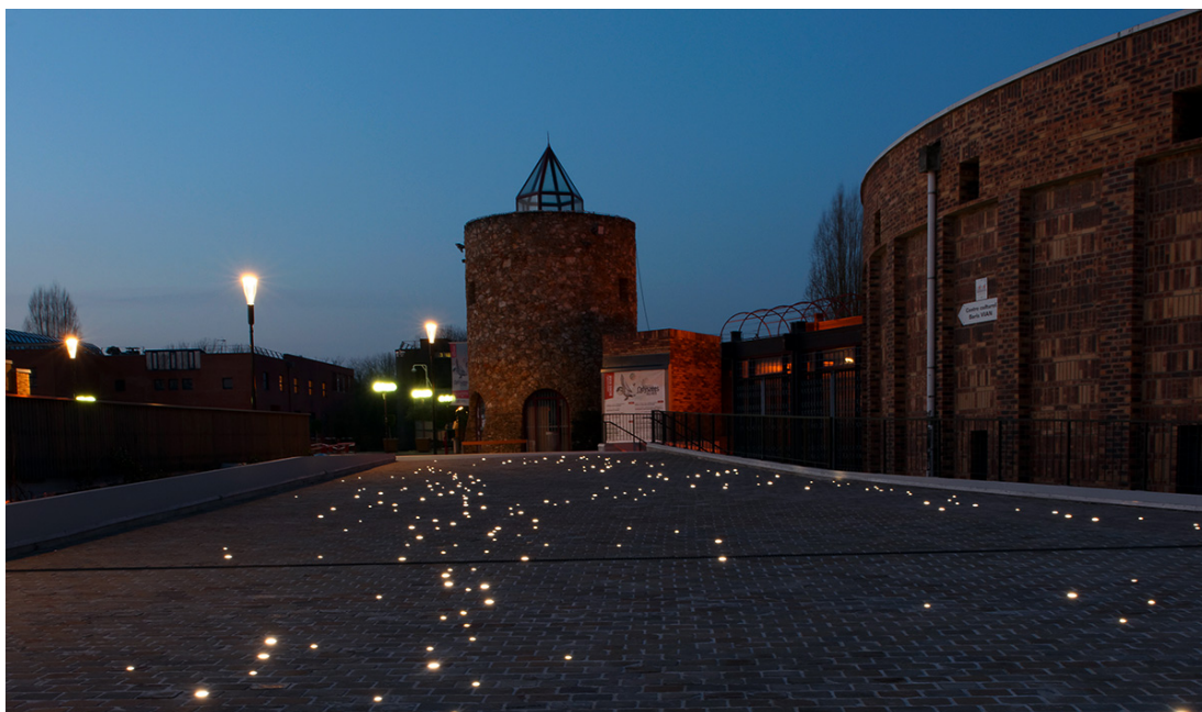
Les abords de l'Espace Culturel Boris Vian sont à la fois joliment mis en valeur et sécurisés.