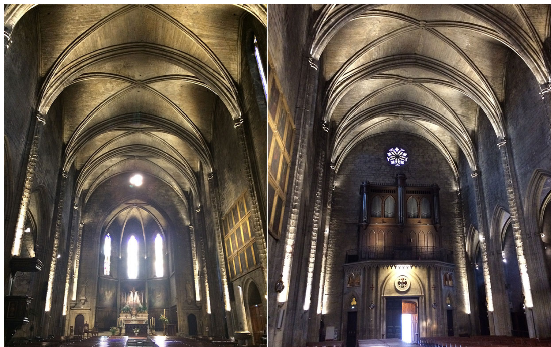
La voûte de la Collégiale est éclairée par 44 projecteurs 4040T-Luminy 4 en 3W blanc chaud, optique 20°.